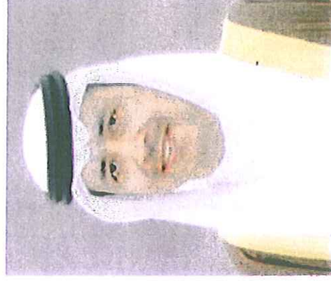
● فهمي الجودر

خلال توقيعه خطاب الترسية لمشروع جسر المنامة الشمالي أكد وزير الأشغال، الوزير المشرف على هيئة الكهرباء والماء، المهندس فهمي بن علي الجودر، أن العمل سيبداً في جسر المنامة الشمالي والذي تقدر تكلفته بـ 98.159.474.000 دينار خلال شهر يونيو الحالي مشيراً إلى أن شركة حاجي حسن وSix Construct سوف تقوم بتنفيذ المشروع.