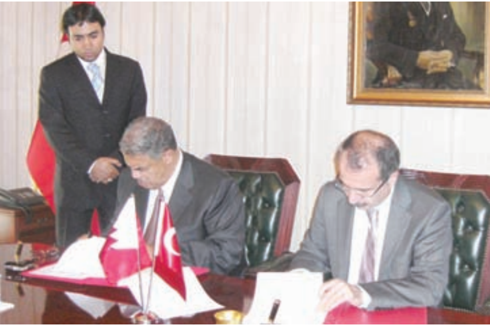
● جانب من توقيع مذكرة التفاهم

وكان وزير العمل الدكتور مجيد بن محسن العلوي أثناء زيارته الى جمهورية تركيا التقى عددا من المسؤولين من بينهم وزير العمل والضمان الاجتماعي التركي عمر دنجار وذلك بمكتبه بالوزارة بمدينة أنقرة واستعرض معه سبل التعاون بين البلدين في مجالات العمل والتدريب المهني والتوظيف.